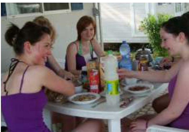
Frühstück im Freien bei herrlichem Wetter

Tag 2 verbrachten wir mit einer Besichtigungstour durch Verona. Die Reiseführerin zeigte uns in einem anstrengenden Trip die ganze Geschichte und die vielen Sehenswürdigkeiten der Stadt, sodass wir bis zum Nachmittag beschäftigt waren. Der Rest vom Tag war zur freien Verfügung für jeden.