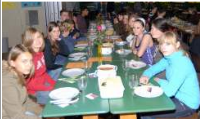
Gemeinsames Mittagessen in der Schule

bei einigen noch beim „Dobrou chut“ (Guten Appetit) geblieben ist.