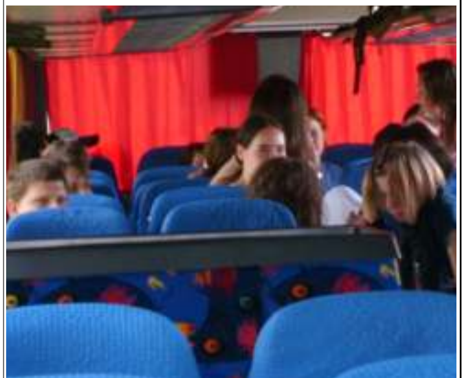
Müde Schüler bei der Heimfahrt

Nachdem wir am Abreisetag in der Früh gepackt hatten und unser Gepäck im Bus verstaut war, konnten wir auch schon unsere Heimreise antreten. Mit Wehmut verließen wir unsere schöne Anlage. Gegen 17:30 Uhr trafen wir dann auch müde in Sulzbach ein.