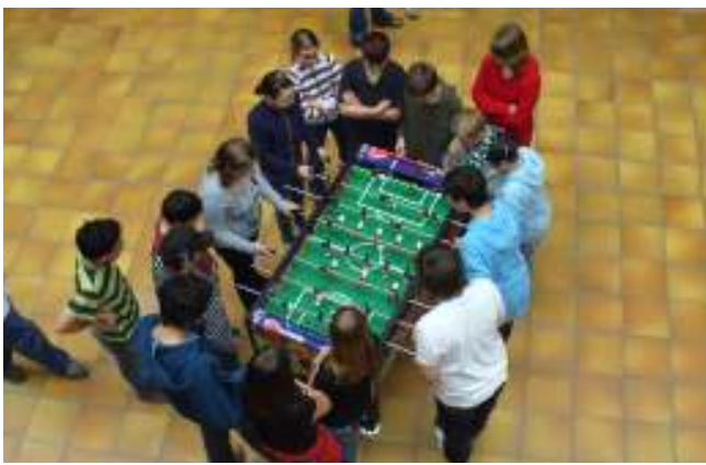
Spannung beim Kickerturnier