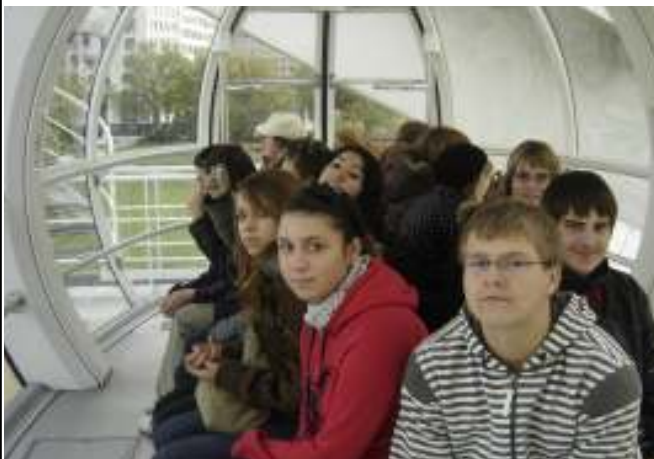
London Eye - das Riesenrad von London

Aufgrund der starken Bewachung des Palastes war es jedoch nicht möglich zur Queen vorzudringen. Aber schon der Wachwechsel der Horse Guard war äußerst interessant. Schließlich trafen die Schüler die Queen doch noch bei Madam Tussauds, auch wenn sie dort nicht recht gesprächig war. Höchst informativ und anschaulich war auch das „Churchill Museum zum Anfassen“, in dem den Schülern multimedial die Geschichte von der Geburt bis zum Tod des Premierministers in den Cabinet War Rooms nahegebracht wurde. „So sollte Geschichtsunterricht immer sein“, war die sponta-