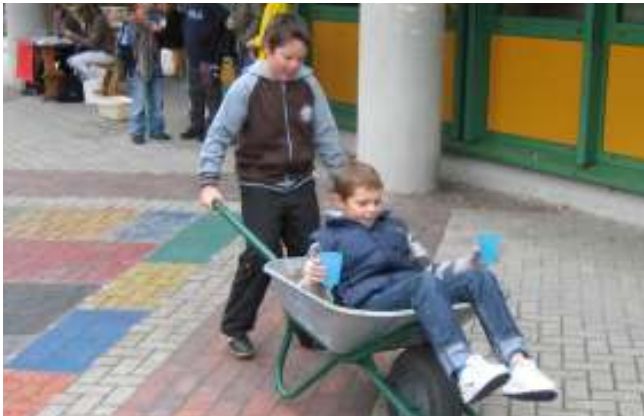
Spiel beim Herbstfest