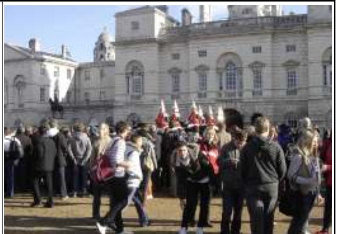
Horse Guard - Wachwechsel

ne Äußerung einiger Schüler. Natürlich durfte bei der Londontour auch die Besichtigung der weiteren Sehenswürdigkeiten wie Tower, Tower Bridge, Big Ben, Westminster Abbey, Covent Garden, Piccadilly-Circus, Trafalgar-Square, China-Town und London Eye nicht fehlen. Bei schönstem Wetter lernten die Schüler schließlich London auch vom Schiff aus kennen und durchliefen in Greenwich den leicht tropfenden Fußgängertunnel unter der Themse, um anschließend mit der DLR durch die Docks und das Bankenviertel wieder ins Zentrum zurückzukehren. Begeistert nutzten die Schüler vor allem auch die Einkaufsmöglichkeiten in London, insbesondere im größten Spielwarengeschäft Europas, dem Hamleys, aber auch in der Oxford Street. Nur bei Harrods bremsen die exklusiven Waren und Preise den Kaufrausch der Schüler.