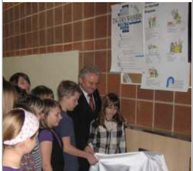
Einweihung des neuen Trinkbrunnens