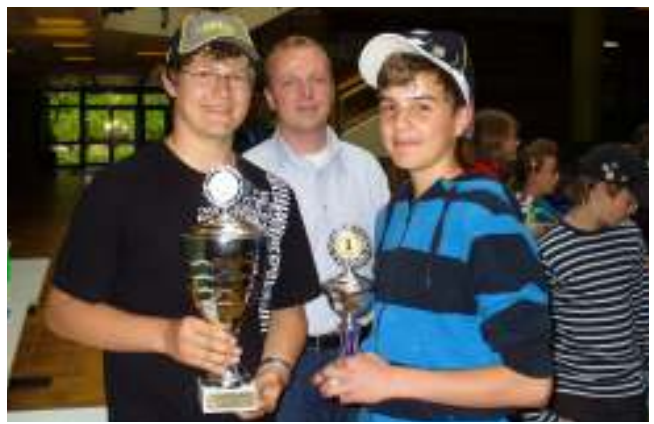
Siegerehrung beim Kickerturnier