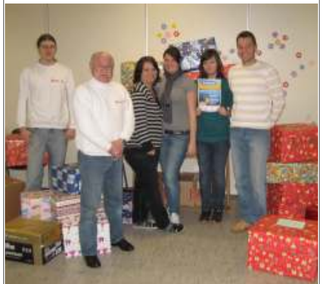
Spenden für die Weihnachtstrucker