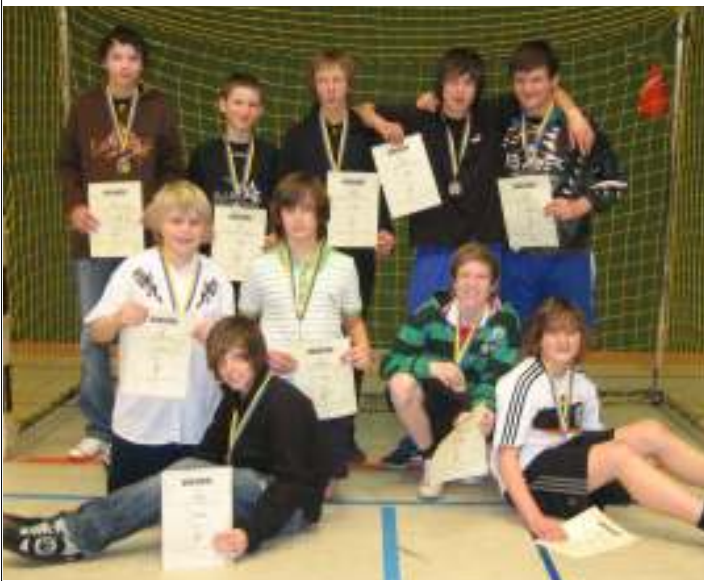
Sieger des Fußballturniers in der Halle