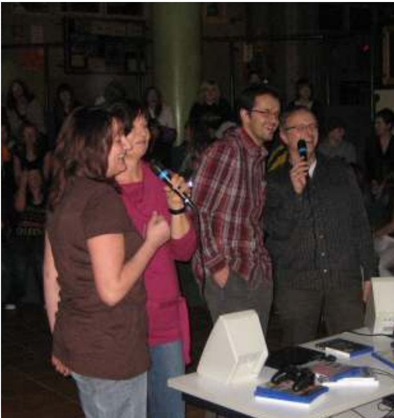
Lehrer- und Elternbeirat-Karaoke bei der Schülerdisco