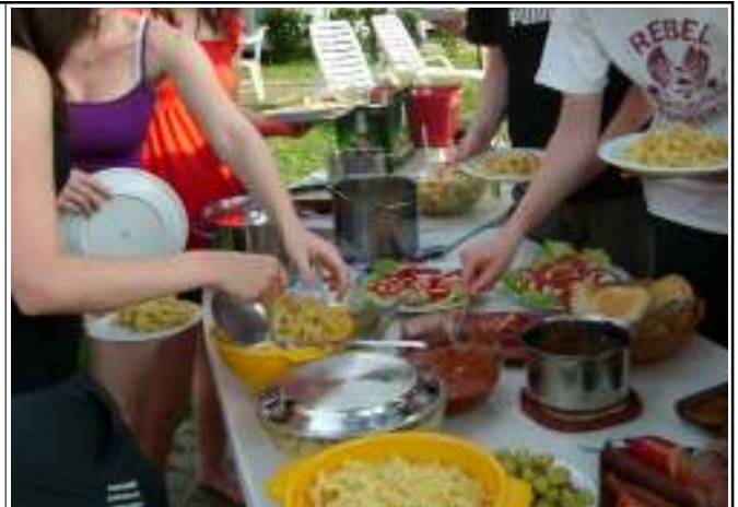
Am letzten Abend wurde gemeinsam gekocht

An einem heißen Mittwoch begann unsere Tagesfahrt nach Venedig. Auf Grund der großen Hitze war die