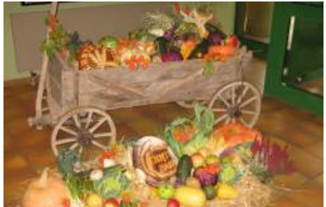
Dekoration beim Herbstfest