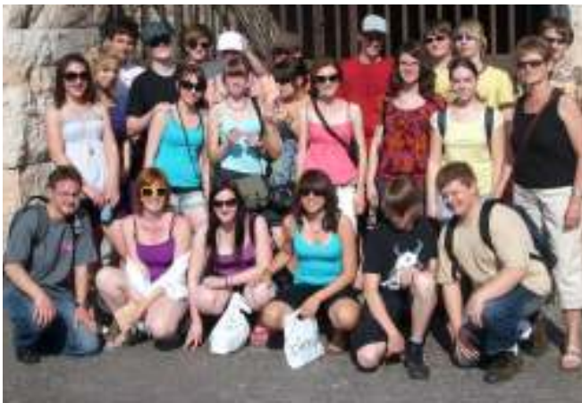
Die Klasse M10/2 in Verona