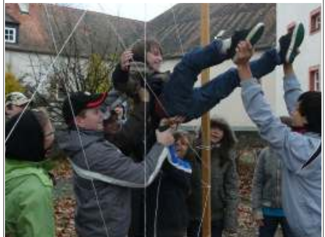
Spenden für die Weihnachtstrucker