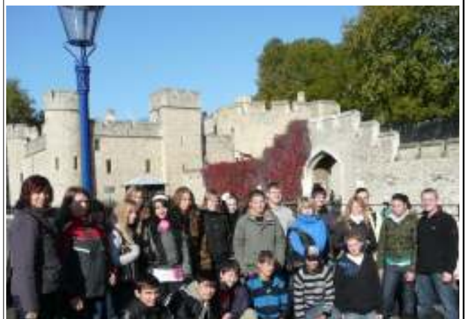
Tower von London

ne Äußerung einiger Schüler. Natürlich durfte bei der Londontour auch die Besichtigung der weiteren Sehenswürdigkeiten wie Tower, Tower Bridge, Big Ben, Westminster Abbey, Covent Garden, Piccadilly-Circus, Trafalgar-Square, China-Town und London Eye nicht fehlen. Bei schönstem Wetter lernten die Schüler schließlich London auch vom Schiff aus kennen und durchliefen in Greenwich den leicht tropfenden Fußgängertunnel unter der Themse, um anschließend mit der DLR durch die Docks und das Bankenviertel wieder ins Zentrum zurückzukehren. Begeistert nutzten die Schüler vor allem auch die Einkaufsmöglichkeiten in London, insbesondere im größten Spielwarengeschäft Europas, dem Hamleys, aber auch in der Oxford Street. Nur bei Harrods bremsen die exklusiven Waren und Preise den Kaufrausch der Schüler.