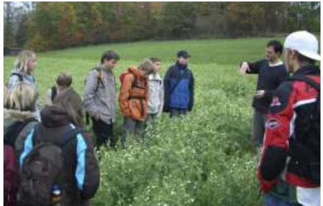
Betriebsbesichtigung Hutzelhof in Weißenberg