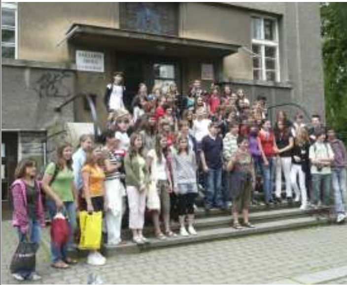
Schüler in Rokycany