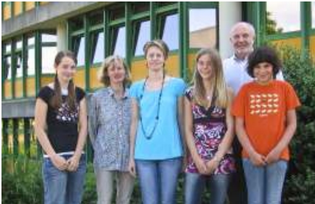
Die besten Sammler bei der LBV-Sammlung