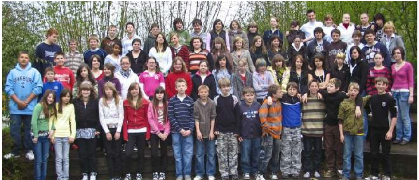
Verkehrs- und Sicherheitstag