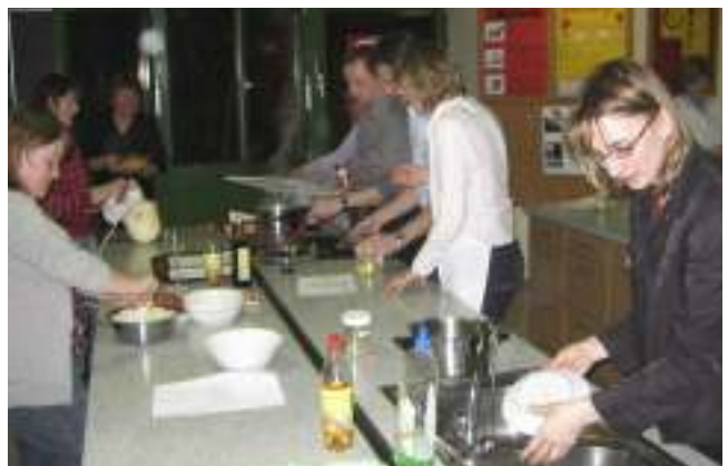
Kochen der Lehrer mit dem Elternbeirat