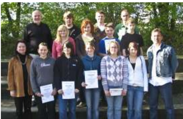
Die Streitschlichter der Schule